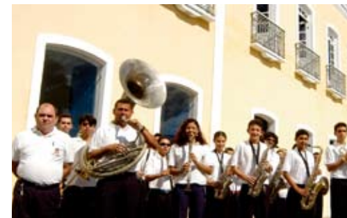
Painel Funarte de Bandas de Música acontecerá em dezembro

O Painel Funarte de Bandas de Música 2008 acontecerá na Oficina Escola de Artes e Ofícios, Cine Falb Rangel, na Casa da Cultura, Theatro São João e ECOA-Escola de Cultura, Comunica-